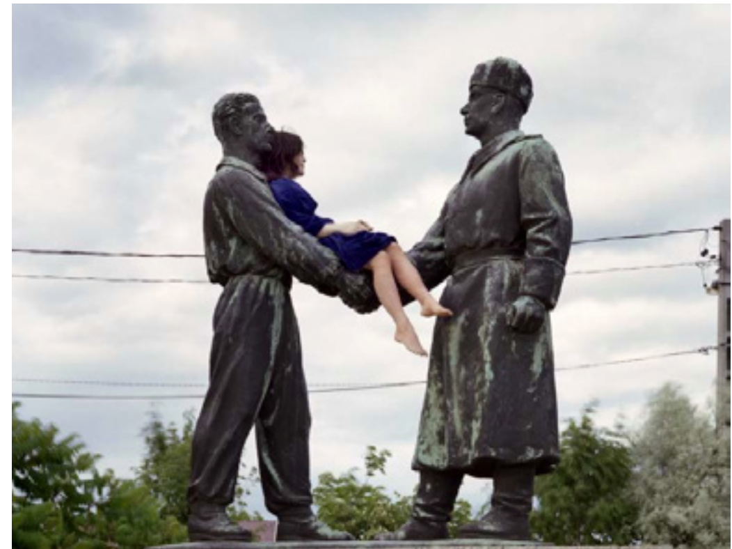
KOPKOP KOPKOP Bijschrift

Sebastopol is een van de twaalf heldensteden van de Sovjet-Unie. Er zijn maritieme musea, straatexposities van moderne Russische artillerie, banieren van de Grote Vaderlandse oorlog en uitzichten op de marinevloot. Een Oekraïnegezinde student schaarde de machtsvertoningen, alsook de geverfd zebra-paden en oplaadpunten voor mobiele telefoons, onder ‘politieke marketing.’